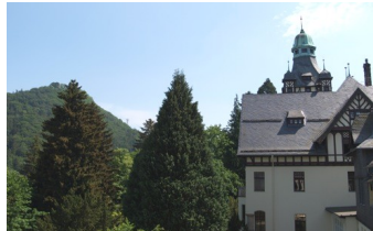
Niedersächsisches Internats- gymnasium Bad Harzburg