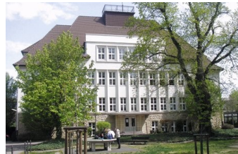
Werner-von-Siemens- Gymnasium Bad Harzburg