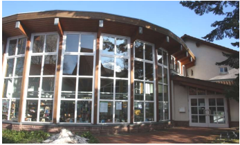
Stadt- und Schulbücherei Braunlage